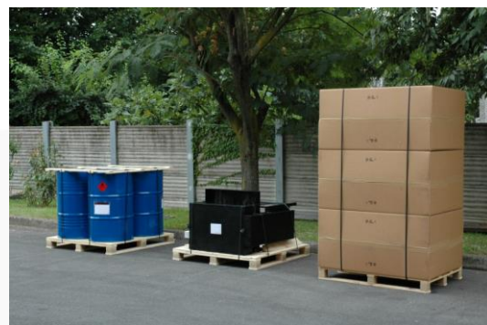
Esempio di fornitura completa per l'incollaggio dei fogli in loco

Le incollatrici possono essere caricate e scaricate a mezzo di un muletto.